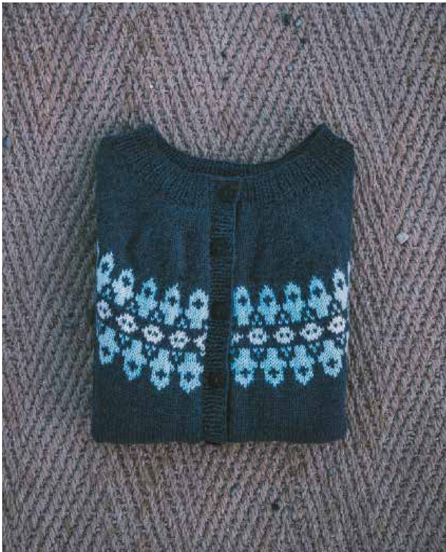
ALPAKKA GRÄBLÄ 6071