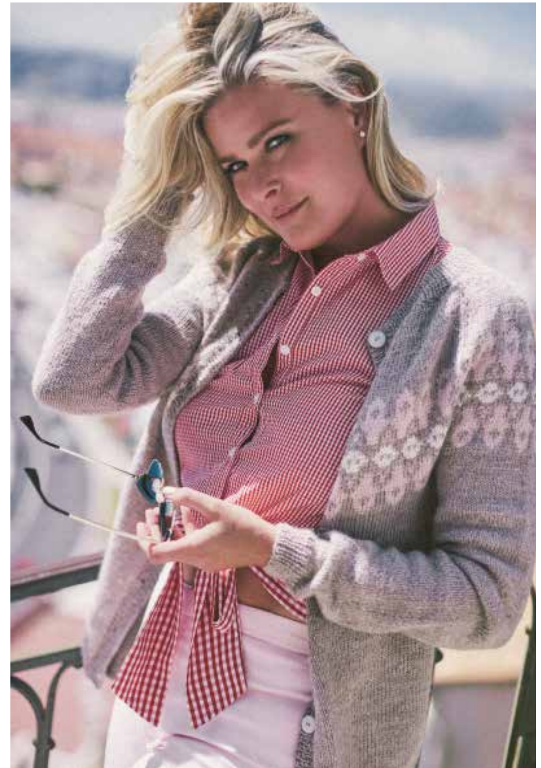
ALPAKKA GRÄBEIGE MELERT 2650